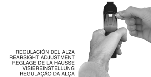
REGULACIÓN DEL ALZA REARSIGHT ADJUSTMENT REGLAGE DE LA HAUSSE VISIEREINSTELLUNG REGULAÇÃO DA ALÇA